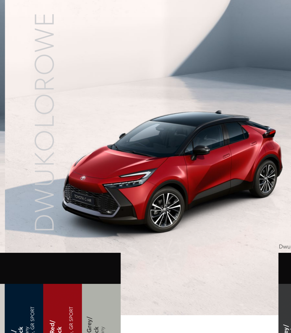
Dwukolorowe nadwozie Bi-tone+

** W wersji Style lakier dostępny wyłącznie po wybraniu Pakietu Bi-tone.